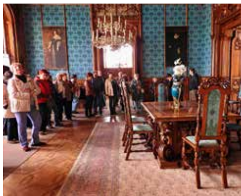
Komnaty v zámku Lednice