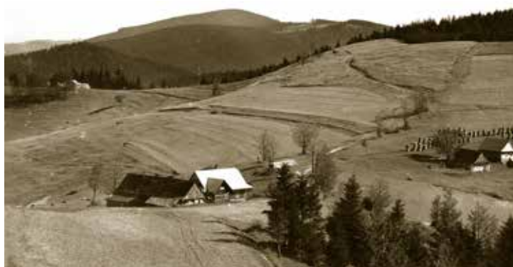
Takovýto pohled na Jezerné se turistům naskytl, když při túře ze Soláně na Benešky sestupovali z úbočí Kyčery do sedla Pod Kotlovou.