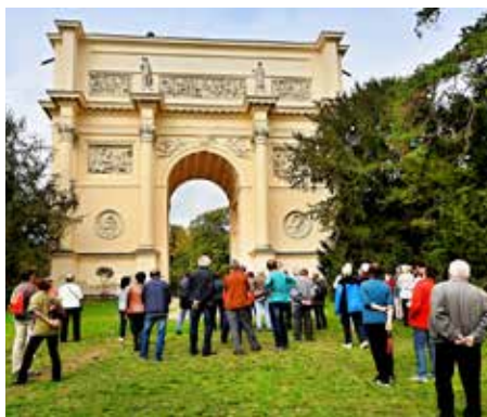
Rendez-vous (Dianin chrám)