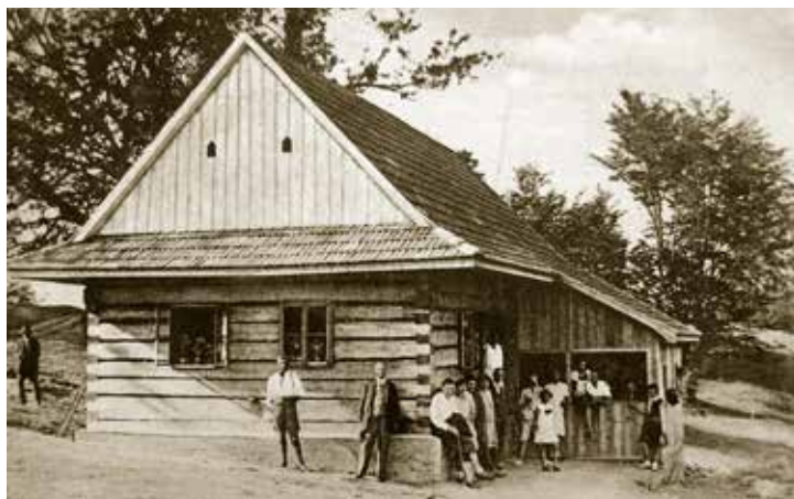
Nouzová chata a noclehárna v obytné chalupě usedlosti č. p. 430.

(Příště Kapitoly z dějin Jezerného. Literární místopis.)