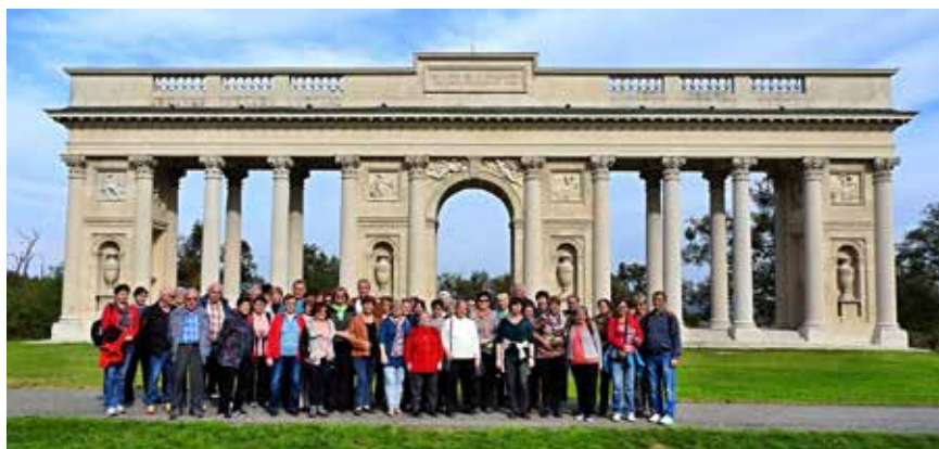
Kolonáda na vrchu Rajstna