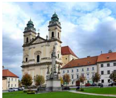
Kostel Nanebevzetí Panny Marie ve Valticích