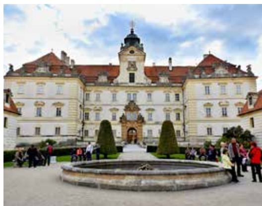
Zámek ve Valticích