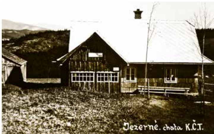
Turistická chata v chalupě č. p. 499 Petra Minarčíka ve 40. letech.